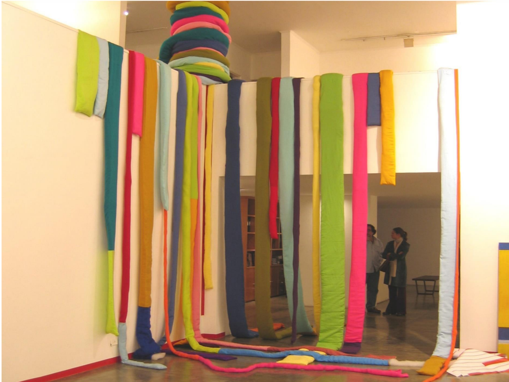
Hormiga argentina en Cromofagia , Galería Nara Roesler SP Brazil, 2005.