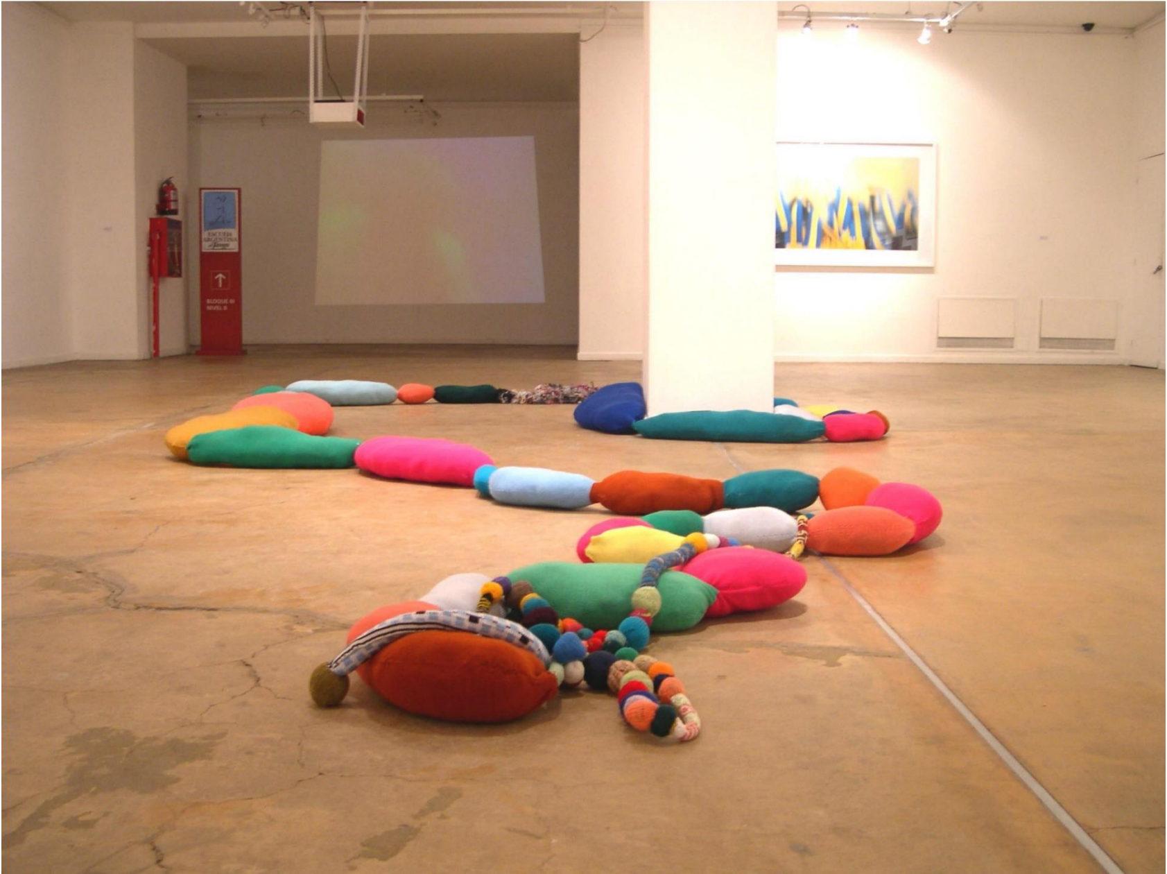
Hormiga argentina en Cromofagia , Centro Cultural Borges, Buenos Aires, 2004.