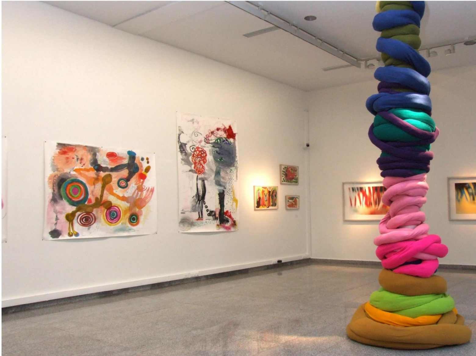
Hormiga argentina en Cromofagia . Sala Gasco Santiago de Chile