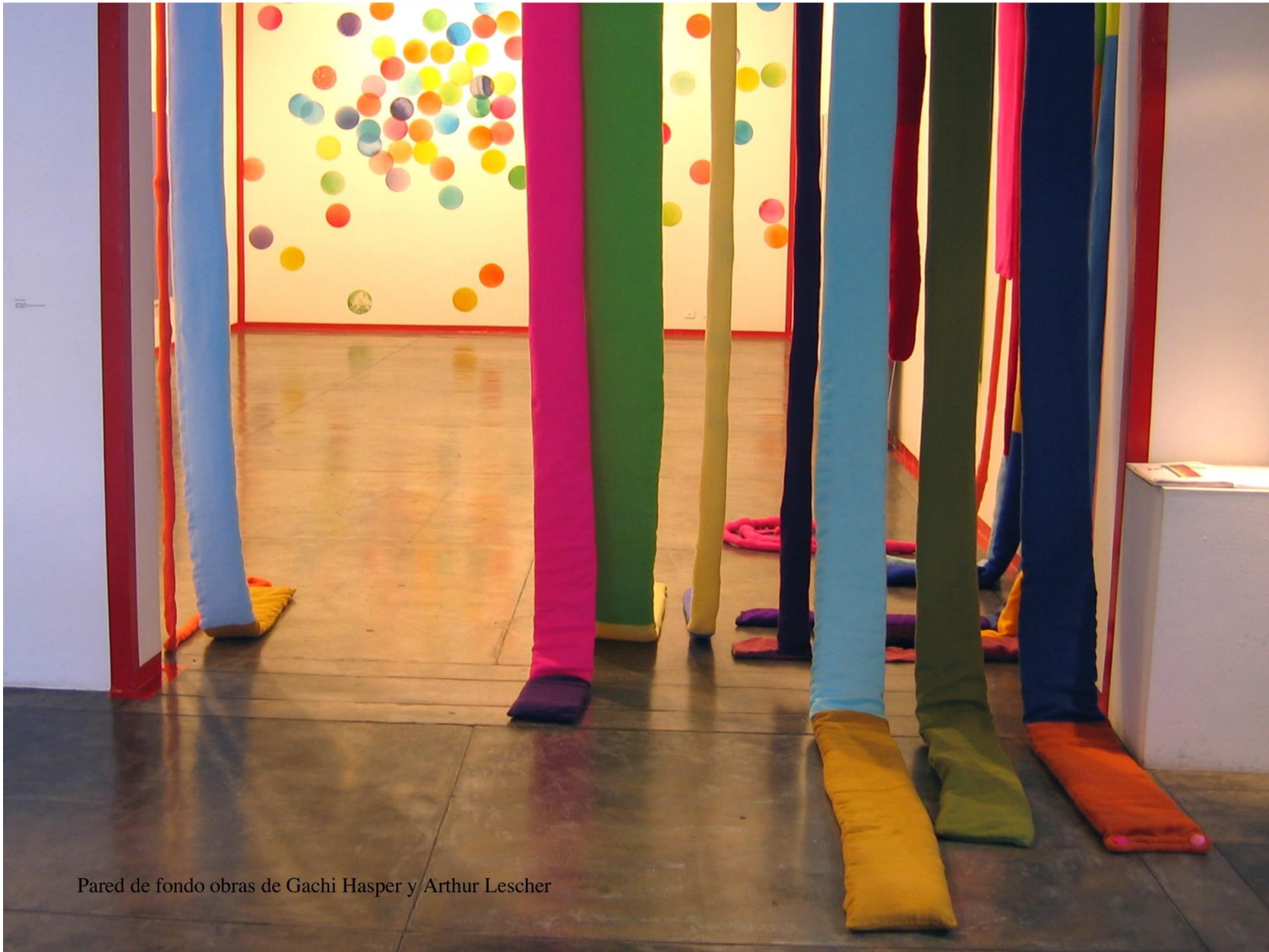
Pared de fondo obras de Gachi Hasper y Arthur Lescher