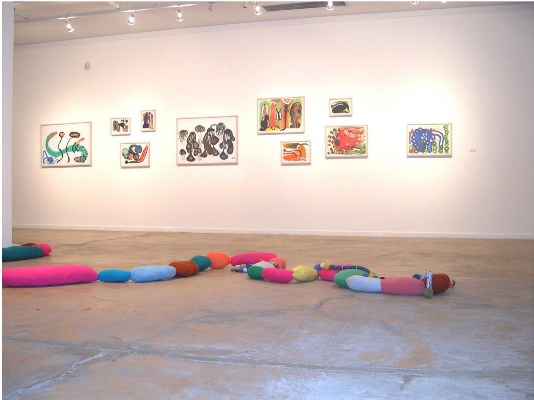
Hormiga argentina en Cromofagia , Centro Cultural Borges, Buenos Aires, 2004.